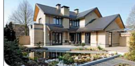
opdrachtgever: Familie de Louw Locatie: Zeeland Omschrijving: Nieuwbouw herenhuis

Onderwijs is altijd in ontwikkeling. Nieuwe inzichten over leren en schoolconcepten spelen daarbij een belangrijke rol. Wie een school gaat (ver)bouwen moet dan ook beslissingen nemen voor de komende decennia. In de ideale situatie is het ontwerp een school waarin kinderen en volwassenen nu en in de toekomst optimaal kunnen leren en werken. Bij het bouwen en aanpassen van onder meer scholen en kinderdagverblijven hebben degelijkheid en veiligheid de hoogste prioriteit. Voortgang is belangrijk: tijdens school- of openingstijden werken we door, waarbij de continuïteit en kwaliteit van het onderwijs of de opvang niet in het geding mag komen. Dat vraagt niet zelden om oplossingen die een unieke combinatie van creativiteit, logica en kwaliteit vormen. Meerdere scholen en kinderdagverblijven hebben zich al kunnen overtuigen van onze professionele aanpak.