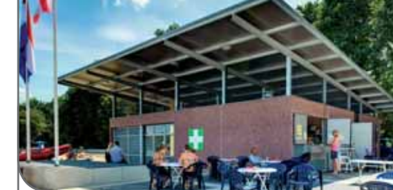
opdrachtgever: Gemeente 's-Hertogenbosch Locatie: 's-Hertogenbosch Omschrijving: Nieuwbouw strandpaviljoen