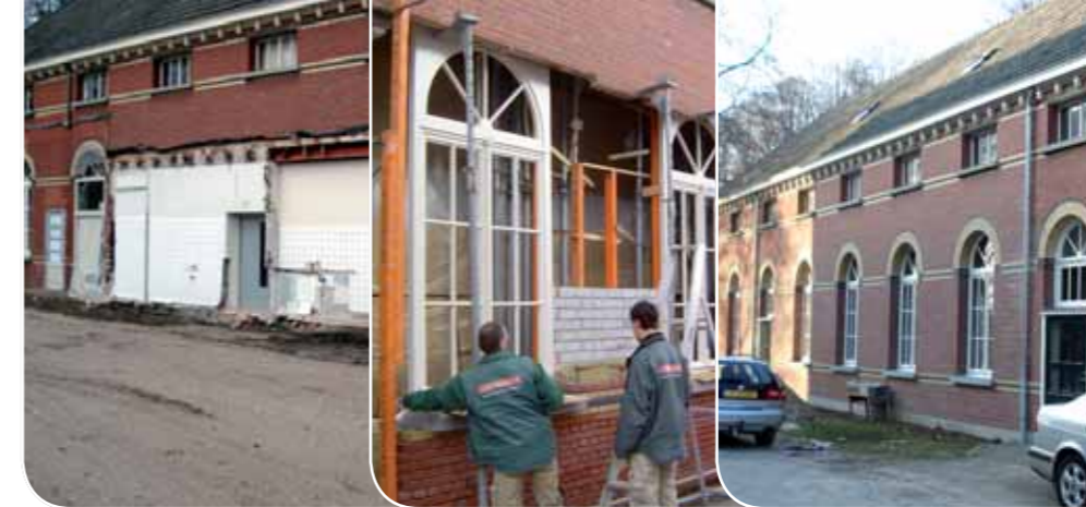
opdrachtgever: GGZ Venray Locatie: Venray Omschrijving: Gevelrenovatie monumentaal pand