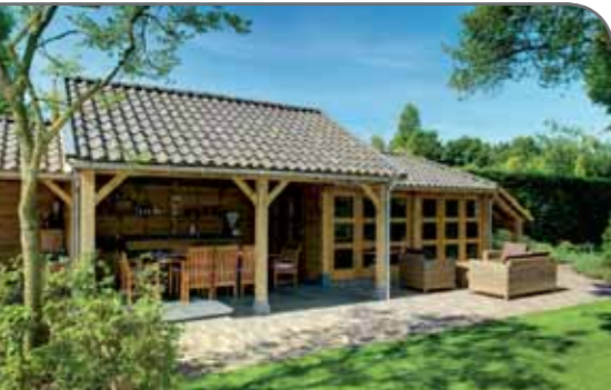
opdrachtgever: Familie van Dongen Locatie: Zeeland Omschrijving: Realisatie buitenkeuken

Waar ligt de grens tussen renovatie en onderhoud? Waar houdt een verbouwing op en begint een ingrijpende vernieuwing? Cornelissen aannemingsbedrijf verstaat het vak van onderhoud en renovatie. We kennen de waarde van historische panden en hebben ruime ervaring met authentieke bouwstijlen. Onderhoud- of renovatieopdrachten worden met de grootst mogelijke zorgvuldigheid uitgevoerd. Met behoud van het oorspronkelijke karakter herstellen we de oude constructie of het uiterlijk van historische panden, zodanig dat de waarde behouden blijft of zelfs toeneemt. Voor onze medewerkers zijn dat extra uitdagende opdrachten, waarbij in het bijzonder ruimte is voor het werk van de ambachtsman.